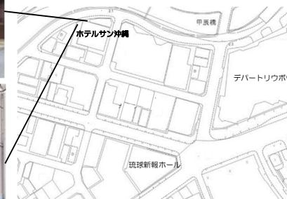
視覚障がい者誘導ブロックの設置予定箇所