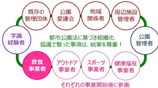
▲構成員のイメージ図

本事業では、多様な主体が関わる「公園協議会」（都市公園法第 17 条の 2）を設置し、地域との合意を図りながら、地域に根差した公園づくりや公園活性化を目指しております。公園協議会の設置は、事業参入していただく民間事業者の皆様にとっても、事業者間の情報が共有できたり、地域の理解を得ながら事業を展開できたり、ルールの見直しを行ったりと、公園運営のメリットがあるものと考えています。それらを踏まえ、質問にお答えください。