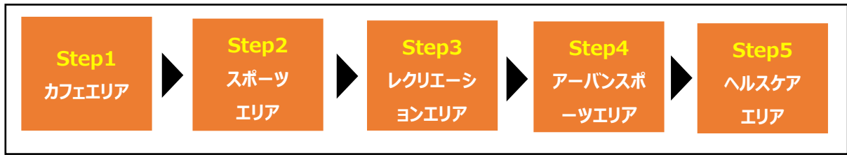
図 2. 官民連携事業等による漫湖公園整備イメージ