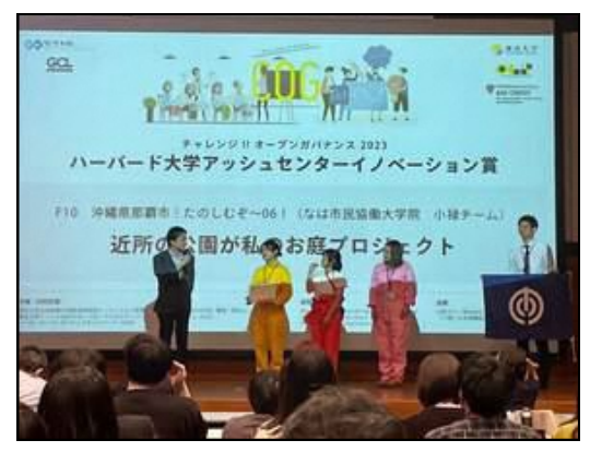
「ハーバード大学アッシュセンターイノベーション賞」を受賞した楽しむぞ～！06