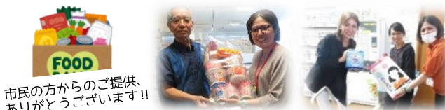
市民の方からのご提供、ありがとうございます!!

※引き渡しの兼ね合いもあり、未開封かつ賞味期限に余裕のある(3カ月以上程度)食料品に限らせていただきます。また、アルコール飲料の寄付についてはお断りさせて頂いております。