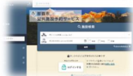
「那覇市公共施設予約サービス」ログイン画面