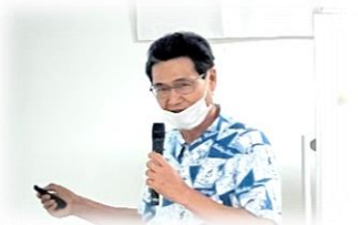
なは市民協働大学

いよいよ次回12/17（土）は『成果発表及び修了式』となります。これまでの講義で学んだことについて各グループで発表していただくこととなります。受講生の皆様の学びや気付きに、事務局の我々も学びを得ることがあるため毎回楽しみですが、今回は2年ぶりの開催という事も相まって、いつも以上に楽しみにしています。