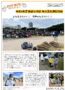
ボランティアレポート 「ボラボ」もよろしく願います!

ボランティアマッチングに関心をお持ちの方(団体)は、どうぞお気軽にお問い合わせください。