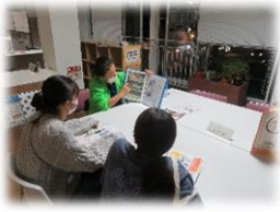
ゆいまーるの会 ブース