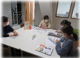
あけぼのほのぼのの会 ブース