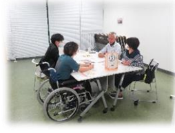
どうしぐあ〜 ブース