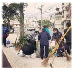
神原ホルト通りの 美化活動の様子

那覇市人材データバンク事業では「ボランティアを求める団体」と「ボランティアを行いたい方(個人・団体)」とのマッチングを行っております。コロナ禍において、感染症対策のため活動に制限がされるなか、ボランティアの内容や活動方法も、コロナに対応した活動を模索する団体も多くなっています。当センターもマッチングだけでなく相談事業と合わせて支援していきます。