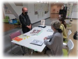
ビブリオサポートいずみ ブース