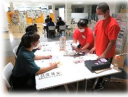
おきにゃあわん ブース