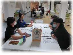
お手を拝借プロジェクト ブース