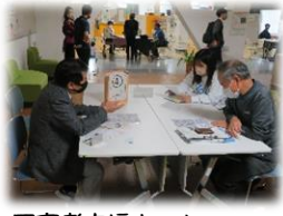
困窮者支援ネットワーク ブース