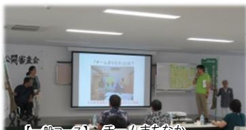
【一般コース】チームまちなか 緑ヶ丘公園ゆいまーるプロジェクト