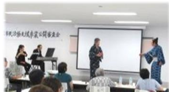
【一般コース】おしゃべりMUSICオフィス 「平数屋朝敏」がやってきた音楽鑑賞会