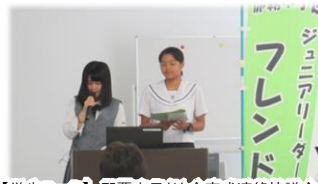
【学生コース】那覇市子ども会育成連絡協議会 ジュニアフレンドリー(中・高校生)養成講座