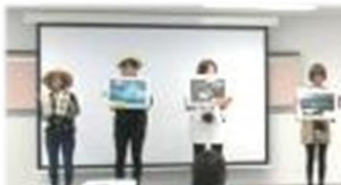
【学生コース】OPD15 漂流プラスチックごみ問題に関する 展示会開催事業