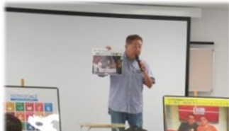
【一般コース】なは市民協議会 「まちづくりハッピーレディオ」でまちを元気に!