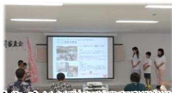
【一般コース】人も犬も猫も幸せな街づくりOKINAWA 犬猫の飼い主または地域住民のマナー向上及び ペット防災の啓発活動