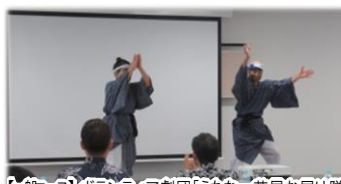
【一般コース】ボランティア劇団「うちなー芝居お届け隊」 ボランティア劇団「うちなー芝居お届け隊」