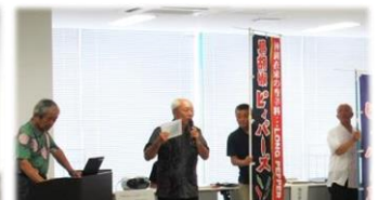
【一般コース】ピースメーカーズを生かす会 ピースメーカーズで長寿復活を!