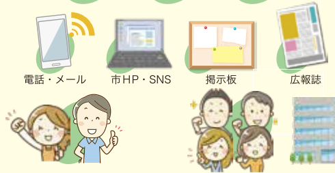
電話・メール 市HP・SNS 掲示板 広報誌