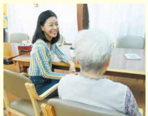
高齢者施設 × 傾聴ボランティア