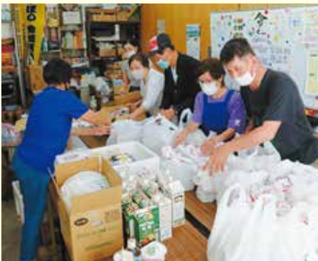
こども食堂 × 企画運営ボランティア