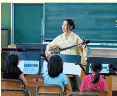
小学校 × 三線指導ボランティア