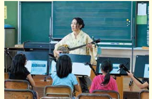
小学校 × 三線指導ボランティア