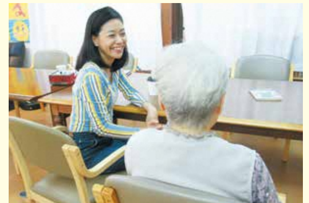
高齢者施設 × 傾聴ボランティア