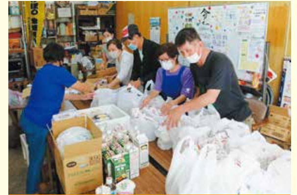
こども食堂 × 企画運営ボランティア