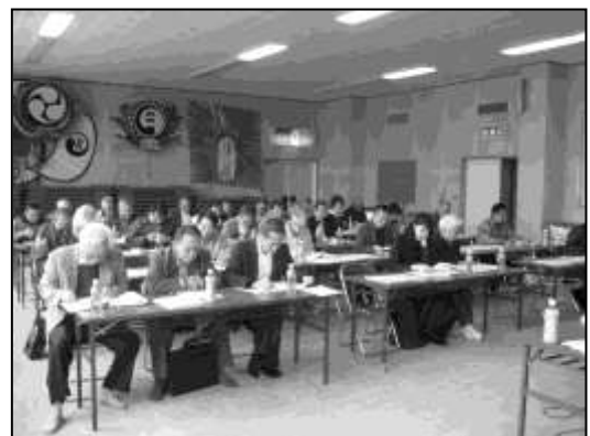
昨年度勉強会の様子

土地の資産運用や情報共有化手法及び組織、人材育成など、課題研究の成果のとりまとめを行いました。詳しい内容は報告書としてまとめており、これまでのものも含めて那覇市総務部那覇軍港総合対策室に備えておりますので、関心のある方は当室までおたずねください。