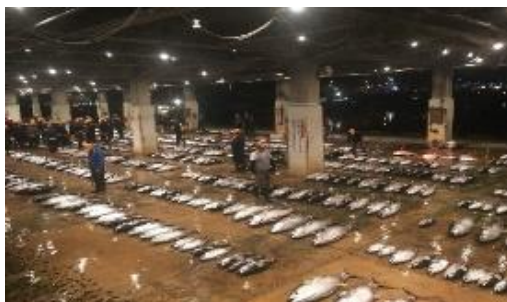
早朝セリ見学との連携