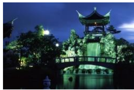
夜間ライトアップの活用