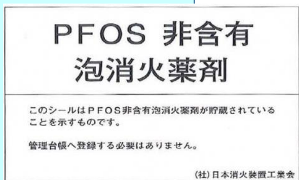
図-6 PFOS非含有泡消火薬剤シール（白色地に黒文字）

PFOS 非含有消火薬剤へ交換した場合には、 法令事項 では ありません が、下記のシールを薬剤タンクに貼付するよう消防用設備を取り扱う業者への依頼をお願いします。