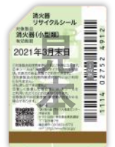
既販品用シール(見本)