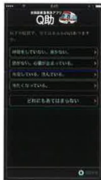
視覚効果 「明度反転」