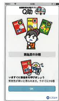
緊急度の分類説明