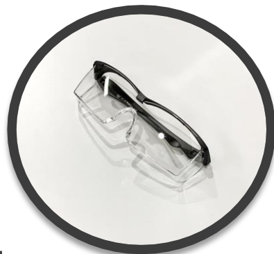
アイゴーグル または