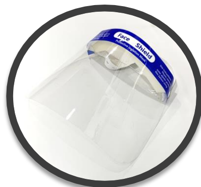
フェイスシールド