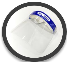
フェイスシールド