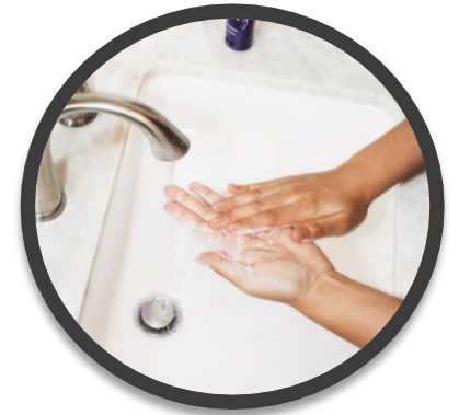
石けん + 流水