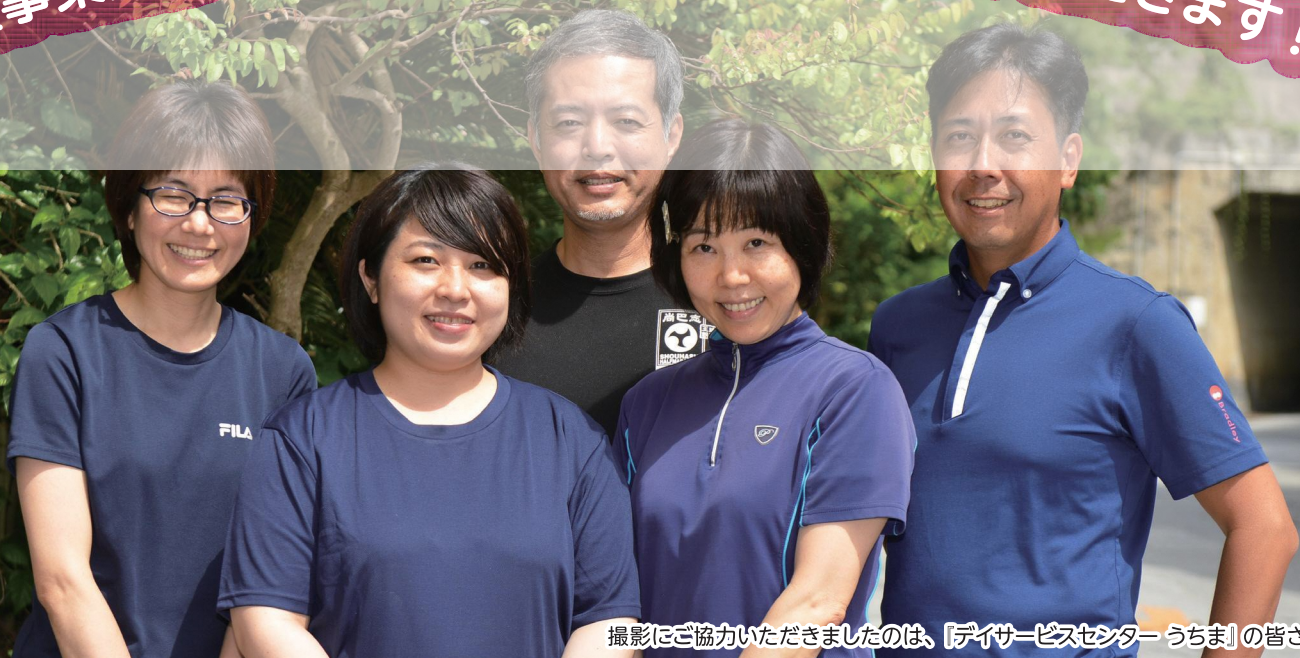
撮影にご協力いただきましたのは、『デイサービスセンター うちま』の皆さんです。

介護職員が現場に定着し、安心して働き続けられるよう雇用管理及び勤務環境の改善を強力に進め、必要な措置を講じましょう!