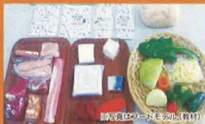
分かりやすい教材を使い、病気の重症化予防や 生活習慣の改善のアドバイスを行います。