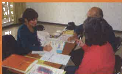
保健師や管理栄養士などの専門スタッフが、 健診結果を分かりやすく説明します。