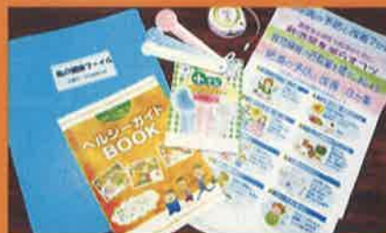
説明の際には1日の食事の目安の資料などを つづった「私の健康ファイル」をお渡ししています。

その他にも、特定健診を受けた方へ家庭訪問や電話による相談なども行っています。 【問い合わせ先】那覇市 特定健診課 (市役所2階32番窓口) ☎098-862-0564