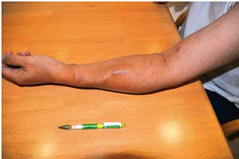
▲シャントの跡が痛々しい左腕

は静脈に刺すのですが、静脈には透析を行えるだけの十分な血流量がないんです。そこで、静脈を動脈に縫い合わせてつないで、動脈の血流を直接静脈に流すシャントを作るんです。私の腕を見てください(写真)。静脈が発達してきて、みみずばれみみずばれになっているでしょ。これで血流が多くなり針がさせるようになるんです。針を刺し、血液を抜いて人工透析器を通して戻す。だから腕には2か所刺します。