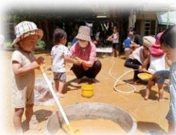
家ではなかなか体験できないどろんこあそび

A 普段は自由あそびといって、お子さんの好きな遊びを親子で楽しめます。年間を通していろいろな育児講座や行事を行っています。下記に少しだけご紹介!!