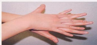
2. 手の甲を伸ばすように洗う