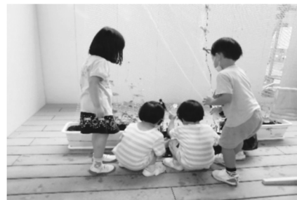
3歳児保育開始（天妃こども園）