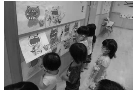
3歳児保育開始（天妃こども園）