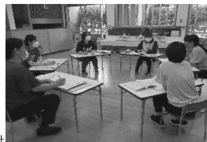
保育の質の向上に向けた園内研修風景