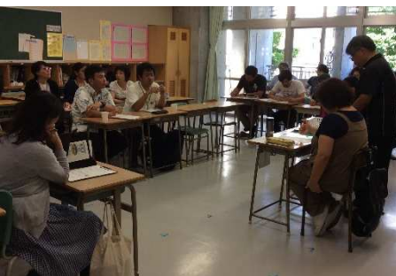
上山中学校グループ 小中合同研修会 H30. 5. 16 於: 上山中学校