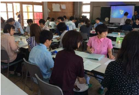
神原中学校グループ 小中合同研修会 H30. 5. 10 於: 神原小学校