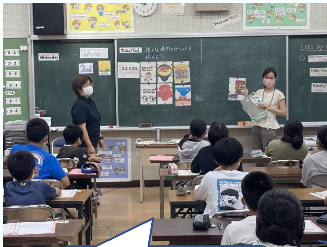
小・中の先生が協力して、授業に臨みます