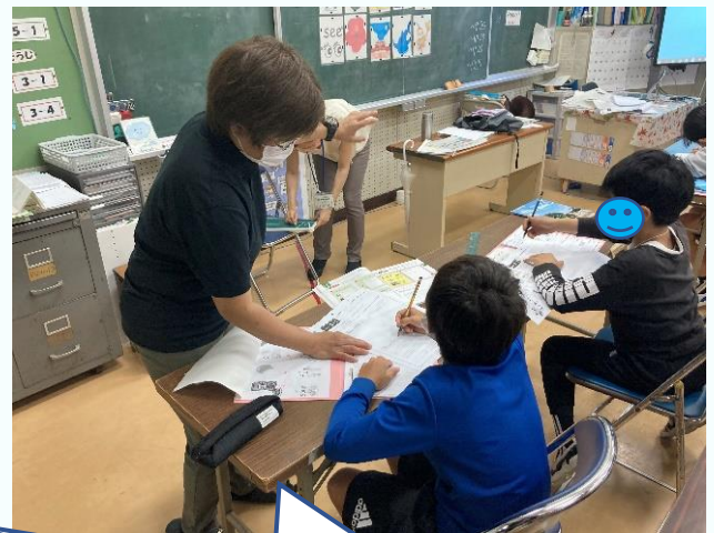
小学校での授業の様子