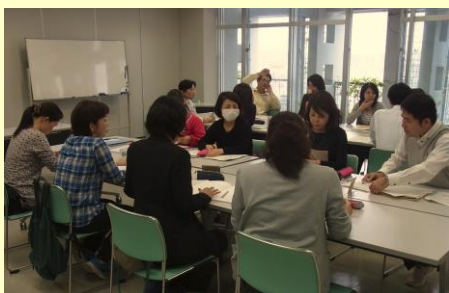
第9回小中一貫教育コーディネーター研修会の様子 グループに分かれての情報交換 H28.3.18（金） 於：那覇市役所12階会議室