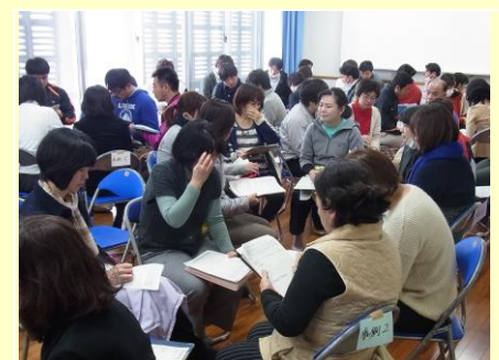
小中合同研修会(ワークショップ)の様子 H28.3.1(火) 於: 寄宮中学校

どのグループも、小学校と中学校の連携が十分にできていない事が課題としてあげられ、小中で、どのように対応するか共通確認しておくことが重要である事が報告されました。