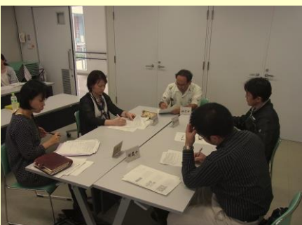
第9回小中一貫教育コーディネーター研修会の様子 次年度の取組（生徒指導面）ワークショップ H28.3.18（金） 於：那覇市役所12階会議室