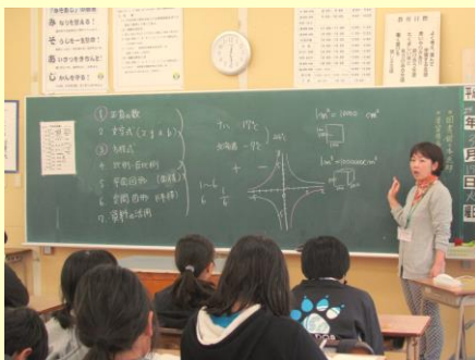
鏡原中登校日の様子 数学の授業を体験 H28.3.15(火) 於: 鏡原中学校