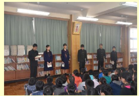
寄宮中学校図書委員のブックトークの様子 H28.1.27(水)

アンケート結果からも、中学生の先輩が直接来て説明してくれたことがすごく嬉しかったです。