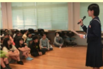
古蔵中学校小中一貫教育グループ 「中学生による学校説明会」の様子 H28.3.17(木) 於: 城岳小学校

平成28年3月15日(火)、鏡原中学校小中一貫教育グループでは中学校卒業式後の空いた3年生の教室を利用して、垣花小学校・小禄南小学校の6年生が鏡原中学校へ登校して中学校の授業体験と小小交流会(児童交流)を行いました。実施内容について下記に紹介します。