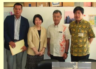
今年度の取組に感謝申し上げます