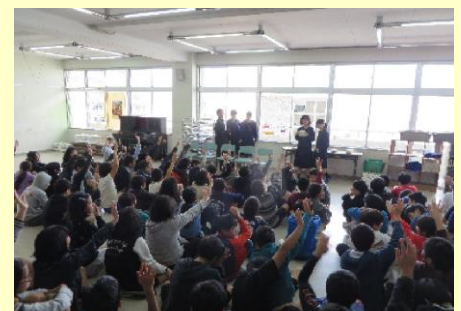
小学生からたくさんの質問が出ました