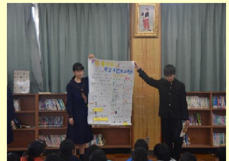
クイズ形式で中学校図書を紹介