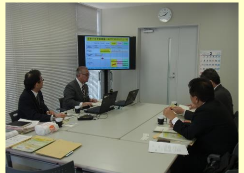
石垣市教育委員会の行政視察の様子 H28.2.9 那覇市役所 11階会議室