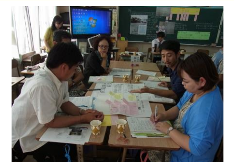
ワークショップの様子⑤ 6学年 社会 グループ協議