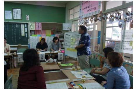
ワークショップの様子① 1学年 国語 グループの発表

小中合同授業研究会は「小中学校の教職員がお互いの専門性に学び、9年間の教育課程及び指導方法を理解することで、子どもたちの発達段階に応じた指導に活かす事」が目的であります。那覇中学校小中一貫教育グループの小中合同授業研究会は、全ての授業で協議の視点が明確にされ、内容の深い研究会となりました。1年生の国語の授業研究会でも、中学校と小学校の教師が真剣に協議している姿が、確実に子どもたちの9年間の成長に繋がっていくと感じました。那覇中学校小中一貫教育グループの先生方の取り組みに感謝申し上げます。