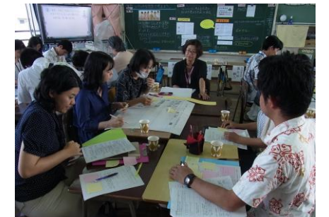
ワークショップの様子② 3学年 算数 グループ協議