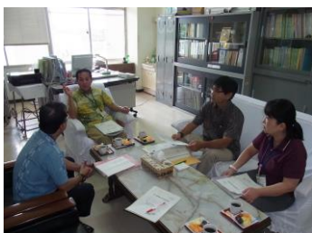
小中一貫教育に係る学校支援訪問の様子 H27. 9. 17 (木) 古蔵中学校