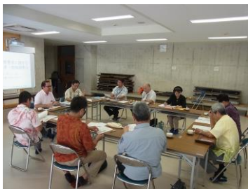
首里ブロック校長会の様子 於：城北中学校