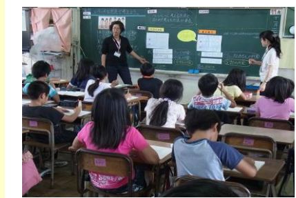
小中合同授業研究会の様子 ② 11. 20 (金) 若狭小3学年 算数