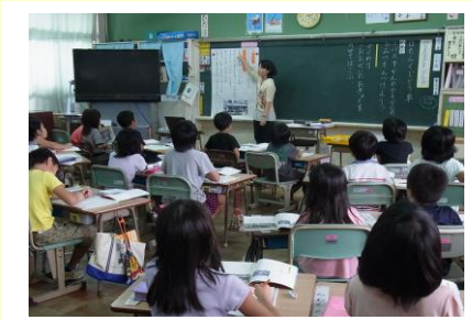
小中合同授業研究会の様子 ① 11. 20 (金) 若狭小1学年 国語