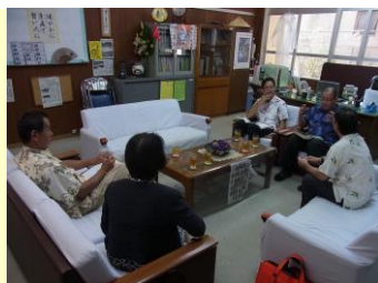
小中一貫教育に係る学校支援訪問の様子 H27. 10. 26 (月) 天妃小学校