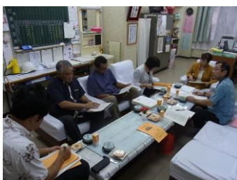
小中一貫教育に係る学校支援訪問の様子 H27. 10. 23 (金) 開南小学校