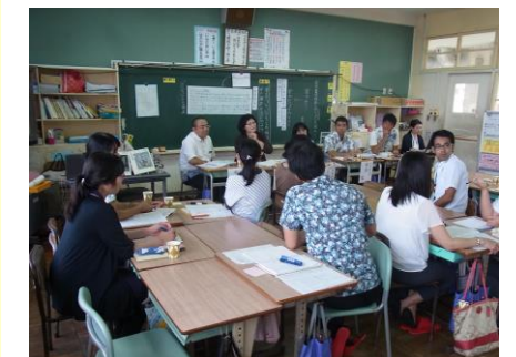
ワークショップの様子③ 5学年 国語 グループ協議