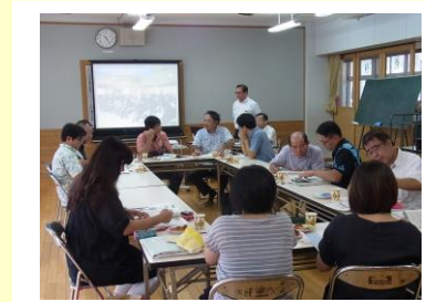
真和志北ブロック教頭会の様子 H27. 11. 17 於：大道小

平成 27 年 11 月 11 日（水）に首里ブロック校長会が城北中学校で、18 日（水）には真和志北ブロック校長会が安岡中学校でそれぞれ開催されました。今回は「保護者・地域説明会」の開催についての説明を行いました。初めに、昨年度の様子、実施内容について説明を行いました。説明会は推進室で導入の経緯や実施校の取り組みの様子、準備状況の説明を行い、小中一貫教育グループで次年度からの取組内容についての説明を行います。その日程調整、グループの発表形態について協議していただきました。また、開催にあたっては、教頭先生を中心に運営が行われますので、11 月 17 日（火）に真和志北ブロック教頭会、18 日（水）首里ブロック教頭会でそれぞれ説明を行い、実施に向けての計画・調整をお願いしました。尚、各グループの保護者・地域説明会の日程につきましては、下記の「主な予定」に記しましたのでご覧下さい。