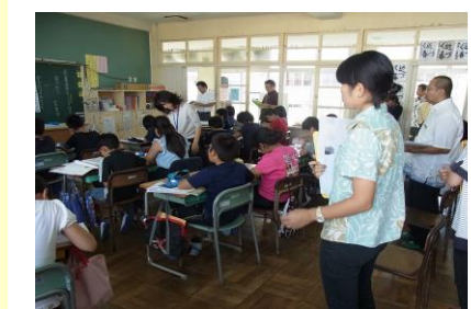
小中合同授業研究会の様子 ③ 11. 20 (金) 若狭小5学年 国語