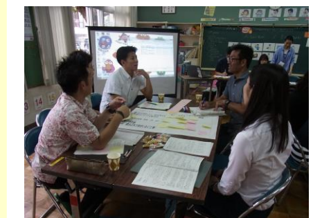
ワークショップの様子④ 6学年 外国語活動 グループ協議