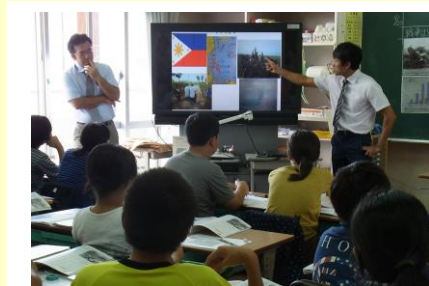
小中合同授業研究会の様子 ⑤ 11. 20 (金) 若狭小6学年 社会

平成 27 年 11 月 20 日 (金)、若狭小学校に於いて那覇中学校グループ (那覇中・若狭小・泊小・那覇小) の第 2 回小中合同授業研究会が開催されました。全ての授業で視点を明確にした協議が行われ、内容の深い研究会となっていました。その内容について紹介します。