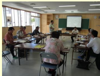
真和志北ブロック校長会の様子 於：安岡中学校