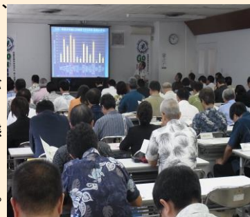
フォーラムのアンケート結果の説明の様子 H27. 11. 25 (水) 於：真和志庁舎

本市としてはまず、今後も、全国的な動きを確認しながら検証を重ね、小中一貫教育を推進してまいります。