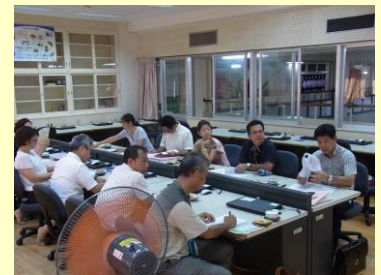
首里ブロック教頭会の様子 H27. 11. 18 於：首里中