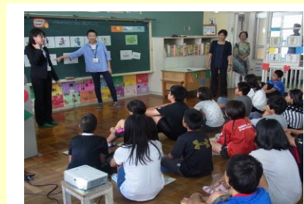
小中合同授業研究会の様子 ④ 11. 20 (金) 若狭小6学年 外国語