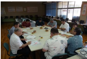
首里ブロック校長会の様子 H27. 10. 7 (水) 於：城北小学校