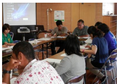
松城中グループ 生徒指導部会の協議 H27. 10. 27 於：松川小学校