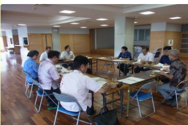
真和志北ブロック校長会の様子 H27. 10. 28 (水) 於：松川小学校