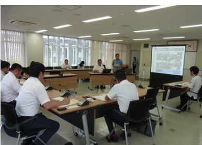
太宰府市議会議員への説明のようす H27. 10. 16 於：本庁議会会議室