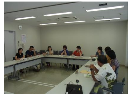
小中一貫教育コーディネーター研修会 H27.10.2（金）於：本庁会議室

「那覇市小中一貫フォーラム」では、本格実施のグループの取り組みを共有し、今後の小中一貫教育の方向性を共通理解するための、意義あるフォーラムになるよう、調整・協議を重ねていきます。