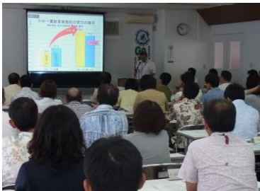
第3回教頭連絡会 2年目の検証についての説明の様子 H27. 10. 21 (水) 於：真和志支所