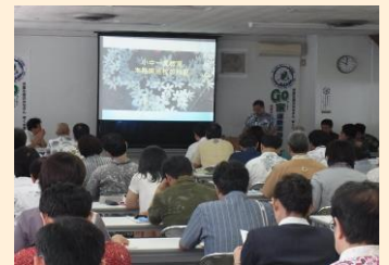
第4回校長連絡協議会 推進状況の説明の様子 H27. 9. 30 (水) 於：真和志支所

初めに、次年度の小中一貫教育の本格実施に向けて、真和志北、首里ブロックの推進状況について報告しました。両ブロックでは、小中合同研修会が開催され、全体での共通確認と、部会に於いて共通実践事項の協議が行われています。