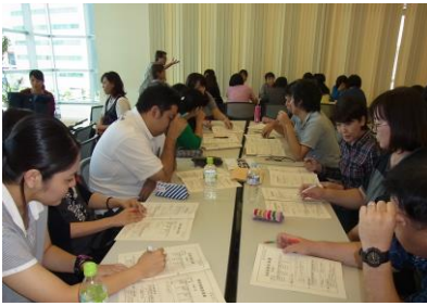
松島中学校グループ小中合同研修会 H27. 10. 13 於：厚生会館ホール

平成 27 年 10 月 13 日（火）、厚生会館ホールにおいて松島中学校小中一貫教育グループ小中合同研修会が、10 月 26 日（月）、松川小学校において松城中学校小中一貫教育グループ小中合同授業研究会が開催されました。その主な内容についてご紹介します。