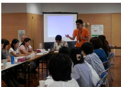
松城中グループ 学習部会の協議 H27. 10. 27 於：松川小学校