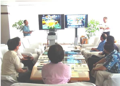
市長・副市長への報告の様子① 6月30日（火） 於：市長応接室