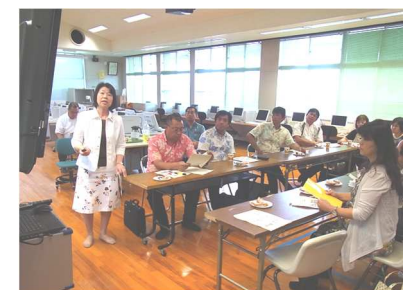
真和志北ブロック教頭会の様子 H27. 6. 30 (火) 於：松島小学校

次年度小中一貫教育の導入となる、真和志北・首里ブロックも第2回小中合同研修会の開催で、具体的に動き始めます。