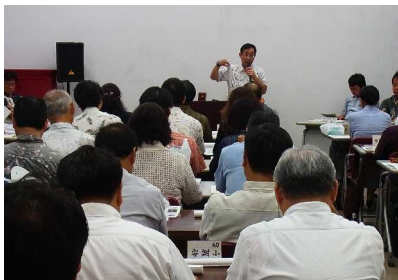
第3回校長連絡協議会の説明の様子② 7月7日（火） 於：対馬丸記念館