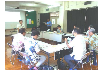
真和志北ブロック校長会の様子 H27. 7. 15 (水) 於：安謝小学校