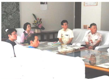
市長・副市長への報告の様子② 6月30日（火） 於：市長応接室

平成 27 年 6 月 30 日（火）、那覇市長応接室において小中一貫教育の推進状況の報告を行いました。