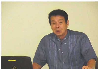
屋部文幹小中一貫教育コーディネーター 7月17日（金） 於：本庁会議室