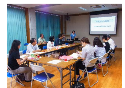
首里ブロック教頭会の様子 H27. 7. 14 (火) 於：城南小学校