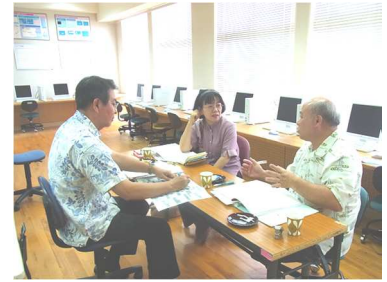
首里ブロック校長会の様子 H27. 7. 8 (水) 於：石嶺小学校

夏休みの小中合同研修会の実施に向けて、校長先生方のきめ細やかな協議が進められました。