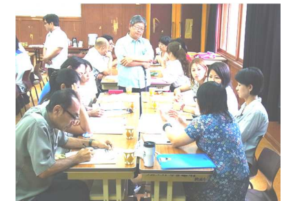
松城中グループ教職員説明会グループ協議の様子 H27. 6. 17 (水) 於：松城中学校

協議で出された多くの意見を活かしながら、次年度の本格実施に向け、準備を進めていきたいと考えております。