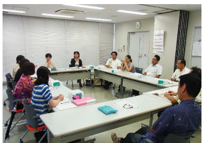
小中一貫教育コーディネーター情報交換会 7月17日（金） 於：本庁会議室