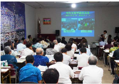
第3回校長連絡協議会の説明の様子① 7月7日（火） 於：対馬丸記念館

校長先生方が小中一貫教育の推進の要です。今後も小中一貫教育の方向性への示唆、助言等よろしく願います。