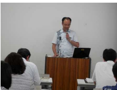
第1回校長連絡協議会の様子 小中一貫教育の推進についての説明 H29. 4. 20 於: 真和志庁舎