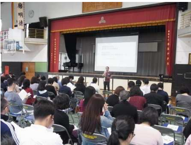
那覇中学校グループ小中合同研修会の様子 H29. 4. 4 於: 那覇中学校