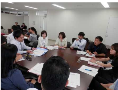
第1回小中一貫教育コーディネーター研修会 第1回小中一貫教育に係る臨時教諭研修会の様子 H29. 4. 12 於: 那覇市役所