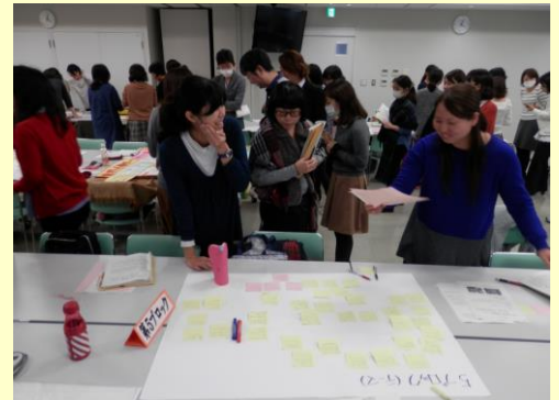
第9回学校図書館事務主事研修会 各ブロックの報告について感想などを伝える H29.2.23（木）於：那覇市役所12階研修室

研修会では、図書館がよりよく機能できる方策や図書館として何ができるのかについての協議内容等についての報告があり、「小学校と中学校では図書館教育計画に様々な違いがある」「小中一貫教育の観点から、小・中学校でどのように図書館教育が実践されているのかを知ることができた」「小中それぞれの良さを取り入れることができ、図書館教育が活性化した」等の報告がありました。