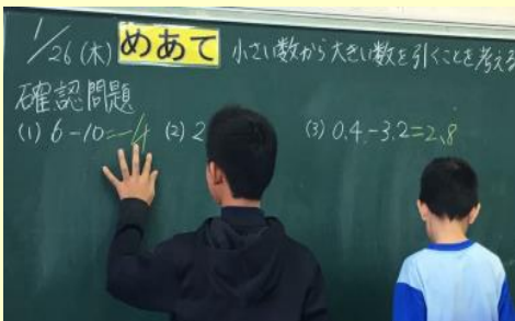
那覇中グループ「那覇中登校日」 数学の授業を体験する泊小学校児童の様子 H29. 1. 26 (木) 於：那覇中学校

本市では平成15年度より文部科学省指定英語教育研究開発学校、平成22年度から教育課程特例校指定を受け、小学校1年生から英語教育を教育課程に位置付け、「児童生徒のコミュニケーションに対する積極的な態度・能力・異文化理解等の素地や基礎を育成すること」を目標に、小・中学校が連携した英語・外国語教育を実践しております。