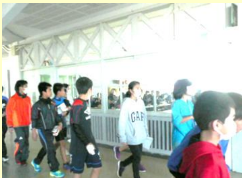
寄宮中グループ 中学校見学 中一授業見学の様子 H29. 2 於：寄宮中学校

実施後、小学6年生からは「中学校の図書館は本がたくさんあって公立の図書館に似ていた」「歴史人物の本もたくさんそろっているのを見たので、中学生になったら早く読みたいと思った」等の感想がありました。