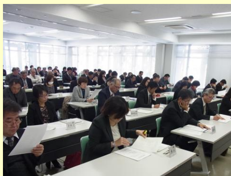
第4回教頭連絡会の様子 H29.2.14(火) 於：那覇市役所 12階