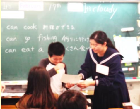
小中が連携した英語授業研究会 児童生徒の交流授業の様子 H29. 2. 17 (金) 於：城西小学校