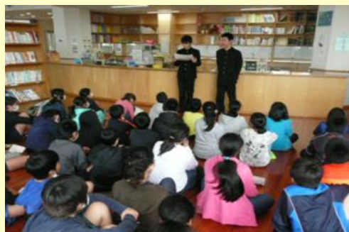
寄宮中グループ ブックトーク 寄宮中学校図書委員がお勧め本を紹介 H29. 2 於：寄宮中学校図書室