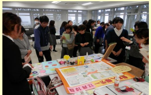
第9回学校図書館事務主事研修会 各ブロックの実践を共有する H29.2.23（木）於：那覇市役所12階研修室