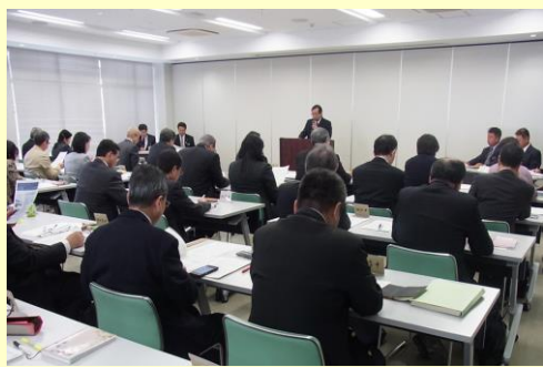
第7回校長連絡協議会の様子 H29.2.10(金) 於：那覇市役所 12階