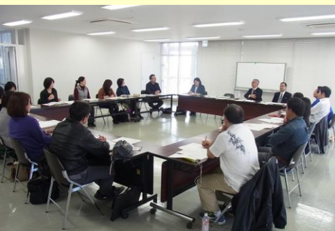
第8回小中一貫教育コーディネーター研修会 質疑応答の様子 H29.1.17(火) 於：那覇市役所 10階会議室