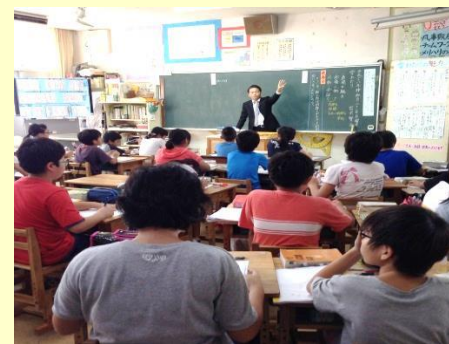
上山中グループ小中合同授業研究会 小学校・国語の公開授業の様子 H28.10.31（月） 於：開南小学校