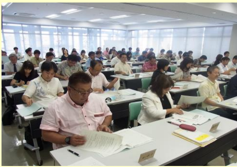
第3回教頭連絡会の様子 H28. 10. 21（金） 於：那覇市役所 12階

その後、小中一貫教育グループごとに児童生徒質問紙からみた成果や課題、これからの取組について協議が行われました。「学年会・教科会・教科の枠を越えた研修会の充実」「小・中学校のつながりを意識した日々の授業実践」等、活発な話し合いが行われました。