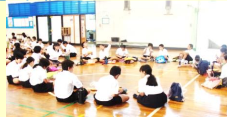
誕生月ごとにグループを編成し一緒に昼食 H28.11.16（水） 於：那覇中学校体育館