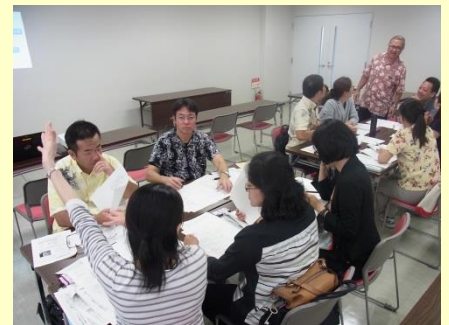
臨時小中一貫教育コーディネーター研修会 実践報告の班別協議の様子 H28.10.20(木) 於: 那覇市役所12階

また、講演では、特別支援教育における現状と課題を受けて、小・中学校の教職員がどのように連携して児童生徒と関わっていけばよいのか等について、講演の中で具体的なお話が聴けると考えております。