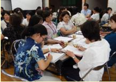
小禄中グループ小中合同授業研究会 ワークショップの様子 H28.9.21（水） 於：宇栄原小学校