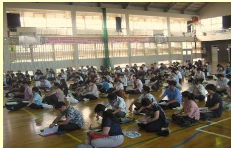
安岡中グループ小中合同授業研究会 全体会の様子 H28.10.24（月） 於：安岡中学校体育館