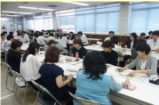
学力向上推進担当者研修会 グループ協議の様子 H28. 10. 17 於：真和志庁舎