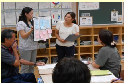
城北中グループ小中合同授業研究会 グループ協議の発表の様子 H28.11.4（金） 於：大名小学校