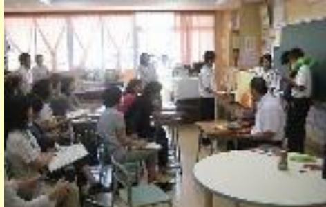
安岡中グループ小中合同授業研究会 特別支援学級生徒による発表の様子 H28.10.24（月） 於：安岡中学校