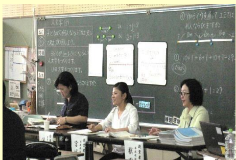
城北中グループ小中合同授業研究会 授業研究会（5学年算数）の様子 H28.11.4（金） 於：城北小学校