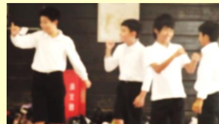
那覇中グループ「6年生仲良くなろう会」 ブーサーシー（沖縄式じゃんけん）で盛り上がる H28.11.16（水） 於：那覇中学校体育館

実施後、小学6年生からは「中学校へのあこがれや期待感が高まった」「他校に友だちができて中学校に行くのが楽しみ」といった感想がありました。また、中学3年生からは「緊張したけど、中学校最高学年として小学生へ合唱が披露できてよかった」等の声がありました。