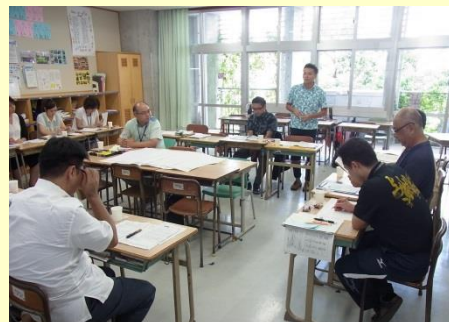
上山中グループ小中合同授業研究会 授業研究会（社会科）グループ協議の様子 H28.9.13（火） 於：上山中学校