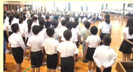
那覇中グループ「音楽交流会」 小学6年生全員で中学生に合唱を披露 H28.11.16（水） 於：那覇中学校体育館