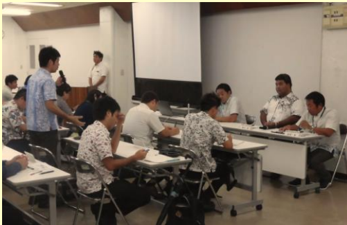
第4回生徒指導主事連絡協議会 パネルディスカッションの様子 H28. 9. 6 於：真和志庁舎