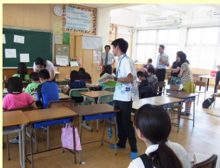
4年生算数の公開授業の様子 H28.6.22（火） 於：那覇小学校