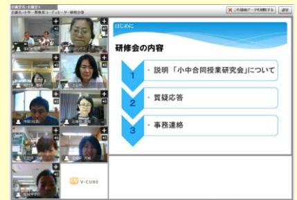
第3回小中一貫教育コーディネーター研修会の様子 H28.6.1（水） Web-meeting 会議システム

平成28年5月31日（火）と6月1日（水）の2日間、Web-meeting 会議システムを活用して第3回小中一貫教育コーディネーター研修会が開催されました。17名の小中一貫教育コーディネーター（中学校教諭）が参加し、今後各グループで開催される「小中合同授業研究会」について研修を行いました。下記に研修会の概要をご紹介します。