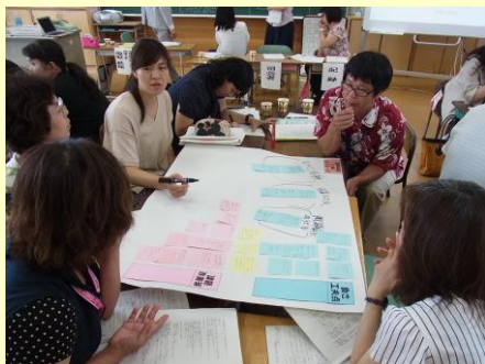
共通実践事項を持ち寄り、協議が深まる H28.6.22（火） 於：那覇小学校