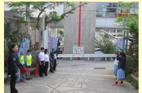
中学生と小学生が一緒にあいさつ運動 H28. 5. 27 壺屋小学校正門