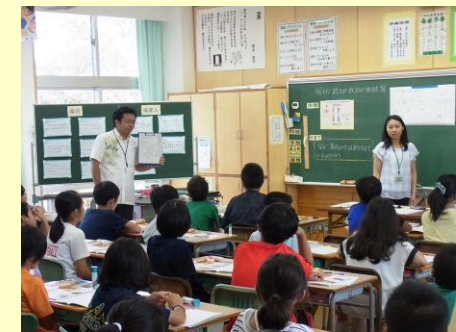
小学校担任と小中一貫教育コーディネーターの チーム・ティーチングの様子（6年生社会）