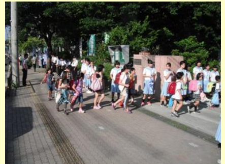
中学生の小学校でのあいさつ運動の様子 H28. 5. 27 神原小学校正門前

この取組みは今年で5年目を迎え、今では自然に小学生と中学生があいさつを交わしている様子が見られました。中学校では、小学生の元気なあいさつに触発され、声を出してあいさつをする姿が見られるようになっているようです。また小学校では、先輩の姿が小学生の手本になっているようです。さらに小学校の先生にとっては、卒業生の成長した姿を見ることができ、中学校生活の様子を聞くことができる交流の場になっているようです。尚、2回目は11月21日～25日に計画されています。