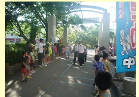
小学生の中学校でのあいさつ運動の様子 H28. 5. 27 神原中学校正門