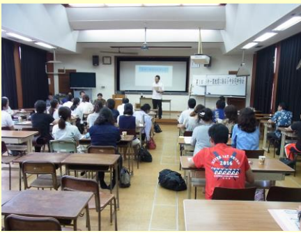
松城中学校グループ小中合同研修会の様子 H28. 5. 27(金) 於：松城中学校