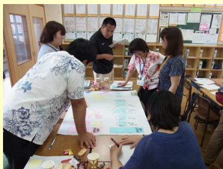
ワークショップで活発な協議が行われる H28.6.22（火） 於：那覇小学校