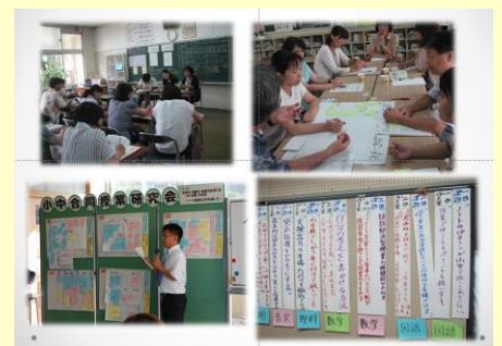
「授業改善の視点」を明確化した 小中合同授業研究会（鏡原中学校グループ）

研修会の後半は「小中合同授業研究会」「小中合同研修会」「乗り入れ指導」等について活発な質疑応答が行われ、なかでも継続して小中一貫教育コーディネーターを務めている先生方から事例を交えて質問者にアドバイスする場面が多く見られ、有意義な研修会となりました。