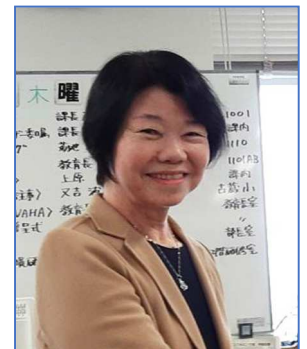
小中一貫教育アドバイザー 委任状交付式にて

沖縄大学 人文学部 こども文化学科教授 元 那覇市立教育研究所所長 元 那覇市立小学校校長 元 小中一貫教育コーディネーター