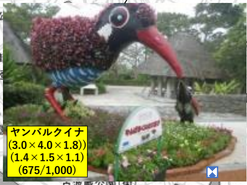
ヤンバルクイナ (3.0×4.0×1.8) (1.4×1.5×1.1) (675/1,000)