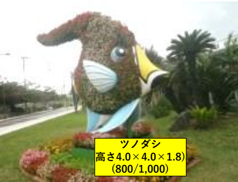
ツノダン 高さ4.0×4.0×1.8 (800/1,000)