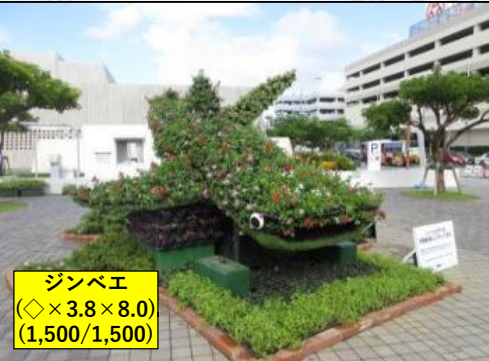
ジンペ (◇×3.8×8.0) (1,500/1,500)