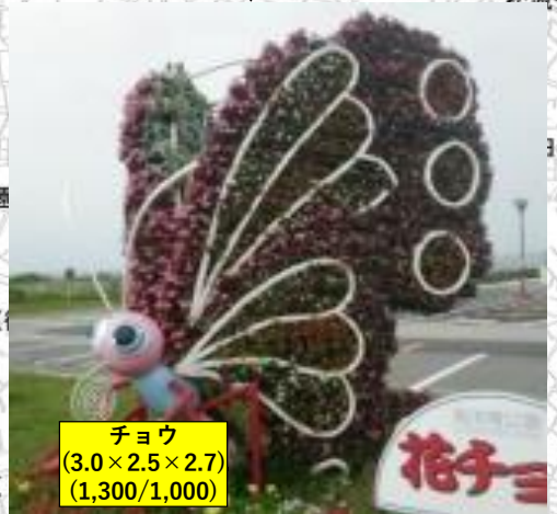
チョウ (3.0×2.5×2.7) (1,300/1,000)