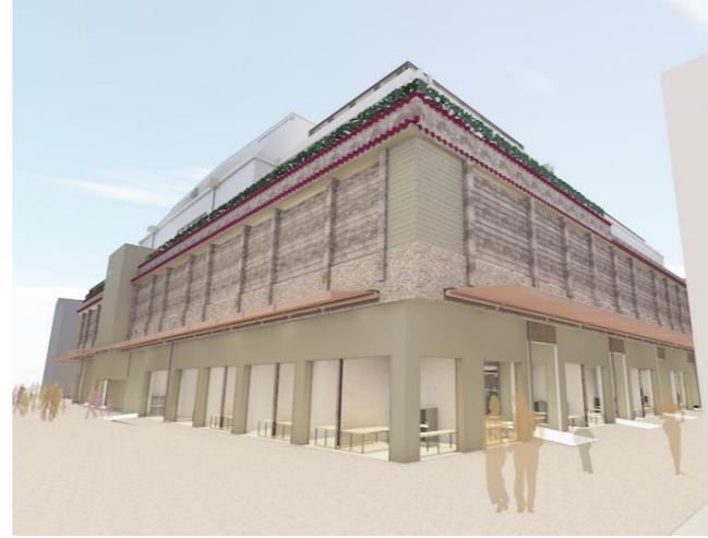
1階外小間外観イメージパース