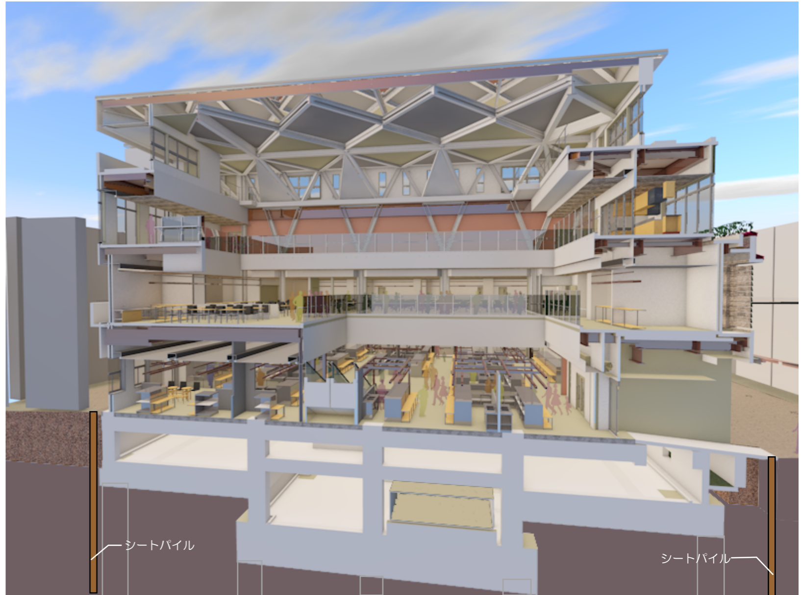
断面イメージパース