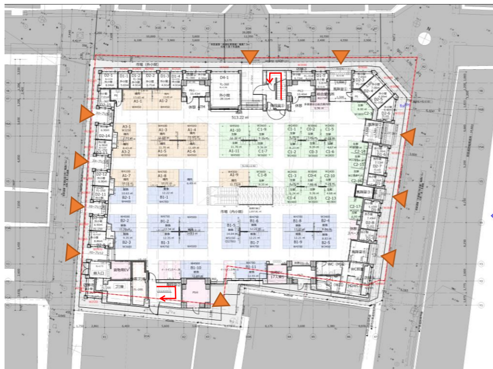
1階平面図（精肉・鮮魚生鮮・生鮮・外小間）