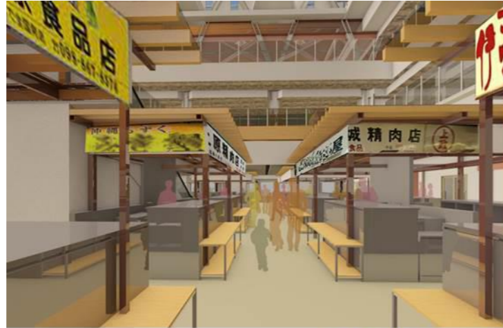
1階内小間イメージ