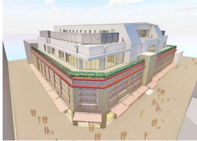
外観鳥瞰イメージパース