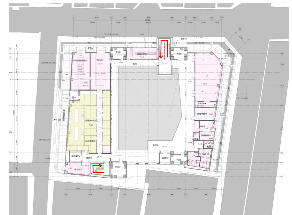
3階平面図（調理体験室・多目的室・管理室・電気室）