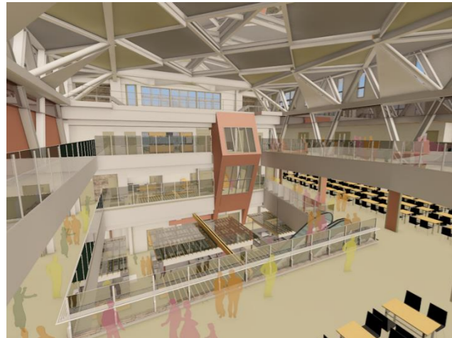
3階からの内観イメージパース