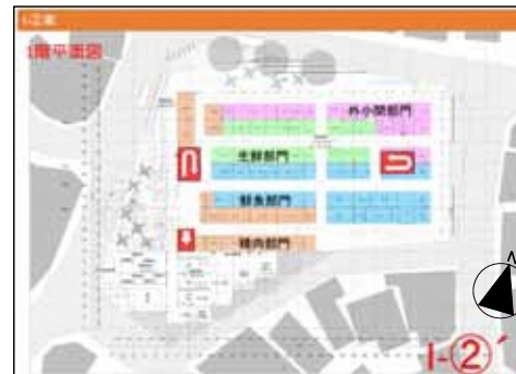
I - 1階平面図