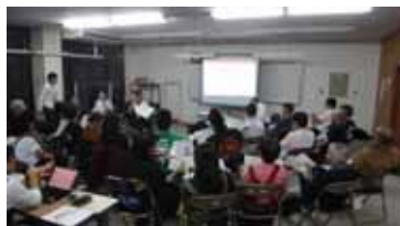
生鮮・外小間部門意見交換会の様子 (12月4日(月)開催)

現市場と同じ配置の方が望ましい。同じ配置が困難であれば、以下の課題を解決してほしい。 クルーズ船寄港時に、外国人観光客が出入口を占拠し、地元客や国内観光客が寄り付かない。鮮魚部門を目的に訪れるので、鮮魚部門の混雑が生鮮部門に影響しない配置を検討してほしい。 エレベーターの場所の問い合わせを受けることが多い。高齢者の利用も多いのでエレベーターの位置がわかりやすい配置としてほしい。