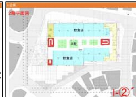
I - 2階平面図