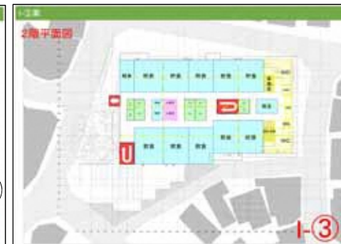
I - 2階平面図