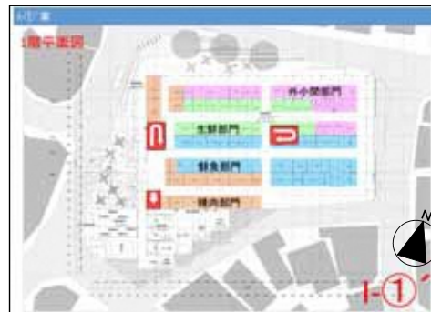
I - 1階平面図