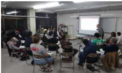
第7回作業部会の様子

第7回作業部会では、17名にご参加いただき、仮設市場のゾーニング案(複数案)について、各部門で話し合っていた結果を報告いただき意見交換を行いました。