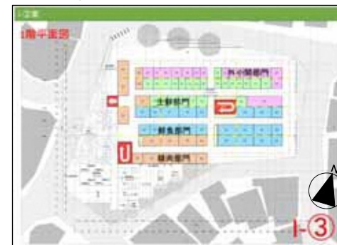
I - 1階平面図