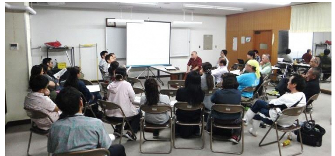
第4回作業部会の様子

第4回作業部会では、17名にご参加いただき、前回の作業部会や全体説明・意見交換会でいただいたご意見等を踏まえて修正した仮設市場の平面計画(案)をお示しし、ご意見をいただきました。