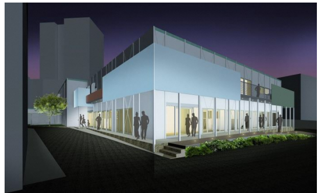
左図:仮設市場 1階平面図