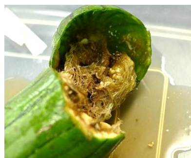
加害されたヘチマ