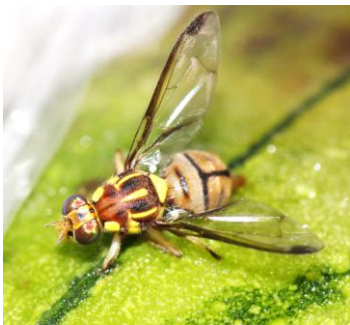
セグロウリミバエ成虫