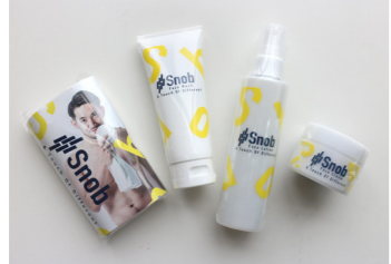
Snobシリーズ(男性用基礎化粧品) 【ベナスタス株式会社】