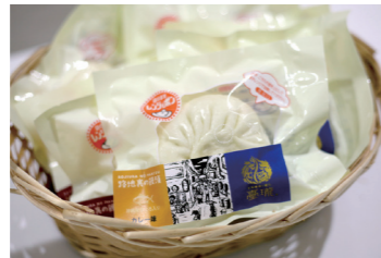
マグロまん(マグロ入り中華まん) 【株式会社オキランド】