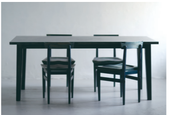
AIJU: 藍樹 (琉球松の藍染ダイニングセット) 【INTERIAN(インテリアン)】