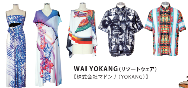
WAI YOKANG (リゾートウェア) 【株式会社マドンナ(YOKANG)】