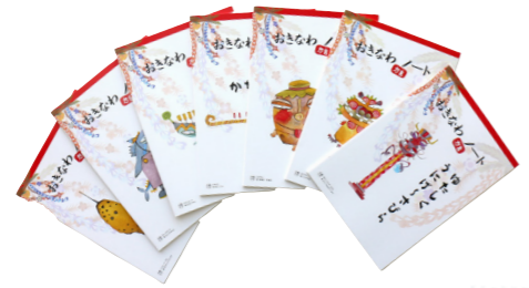
ノート・カレンダー・メモ 制作:株式会社翔コピーセンター