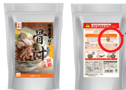
宮良そばの骨汁(令和元年度 新商品開発支援事業にて開発)

原材料に泡盛を使用している商品に 常務の「りゅうきゅうあわもり」を使用した一例です。 好きなキャラクターを自由に使用してみてください!