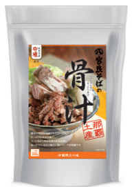
宮良そばの骨汁 【株式会社ニューロンシステム】