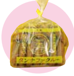
タンナファクルー (株)丸玉 牧志1-3-35 ☎867-2567