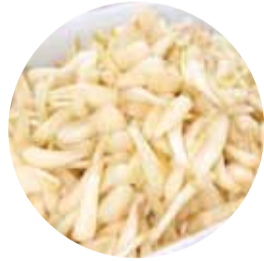
島らっきょう塩漬け 平田漬物店 松尾2-10-1第一牧志公設市場内 ☎867-0950