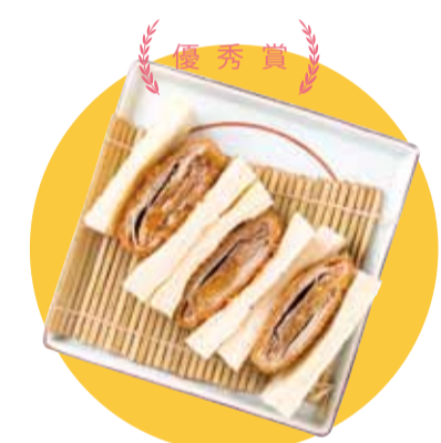
優秀賞 みなみの柔らかミルフィーユカツサンド

「おばあちゃんでも食べられるカツサンド」をコンセプトに開発。豚肉は冷めると固く感じることがありますが、薄い肉を重ねて層にすることで、やわらかいカツにし、冷めてもおいしく召し上がれます。沖縄の食文化である豚料理の新しい一品です。