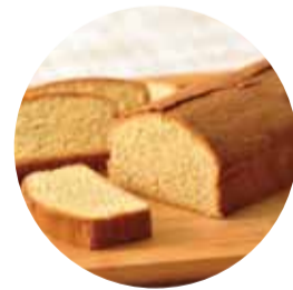
バナナケーキ いづみ洋菓子店 繁多川2-1-57 ☎855-0345