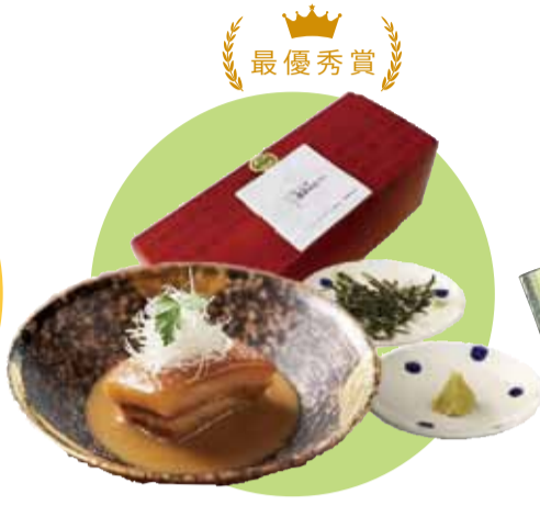
最優秀賞 なぎいろの元祖首里味噌ラフテー

琉球料理のおいしさを伝えるため、徹底的に味にこだわった一品。元琉球王家御用達玉那覇味噌醤油の味噌と首里の全酒造所の泡盛、県産豚を使用。風味維持の独自製法と冷凍真空パックを採用し、パックごと温めるだけで簡単にお店の味を堪能できます。添付のわさびと海苔で味の変化を楽しめます。