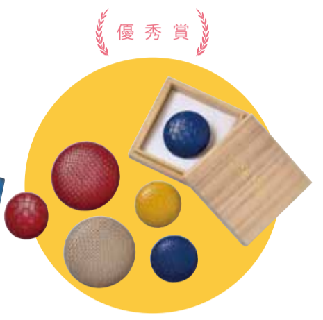
優秀賞 Uiブローチ/Uiピアス

Sui-me(那覇伝統織物事業協同組合) 牧志3-2-10 てんぶす那覇2F ☎868-7866