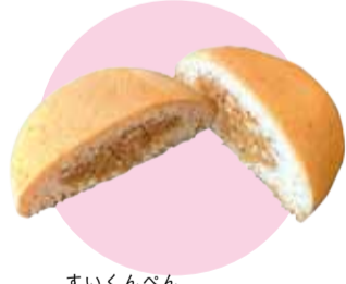
すいくんべん 首里薫餅(小) (株)首里知念製菓 首里石嶺町2-260-1 ☎884-3813

昭和以前からの長い間、市内で製造・販売され、市民に親しまれている商品に那覇市長賞100周年特別賞を授与しました。