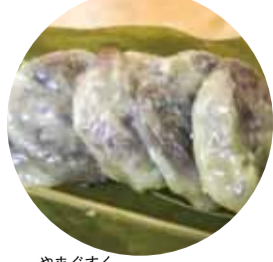
やまくすく 山城まんじゅう 山城まんじゅう 首里真和志町1-58 ☎884-2343