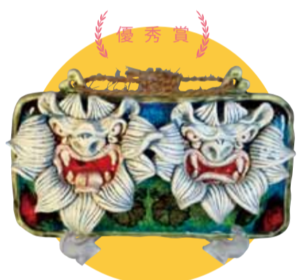
優秀賞 白寿面シーサー・琉球面シーサー

沖縄伝統工芸で難しいとされていた粘土と琉球ガラスの融合を実現。陶板を土台にした面シーサーに沖縄の海をイメージした琉球ガラスを敷詰め、口内には赤ガラスを入れて焼成。魔除けだけではなく、長寿と繁栄の願いを込めて製作しました。