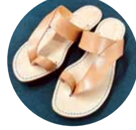
革サンダル (株)大田製靴店 松尾2-2-28 ☎860-4192