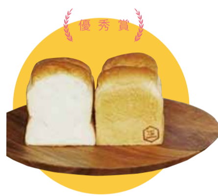
優秀賞 国王の食パン

コロナ禍で観光客が激減した識名園、地域を盛り上げようと1年がかりで開発。最高級の小麦粉、純生クリームを配合し、米糍の甘味により、砂糖を減らして体にやさしい甘みに仕上げました。湯種製法により、もちりした食感をお楽しみいただけます。