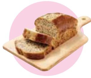
バナナケーキMサイズ (有)ボンファン 古波蔵1-1-6 ☎834-2680