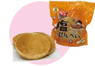
塩せんべい (株)丸吉塩せんべい 繁多川4-11-9 ☎854-9017