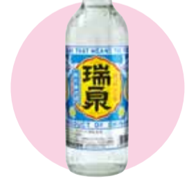
瑞泉新酒600ml 瑞泉酒造(株) 首里崎山町1-35 ☎884-1968