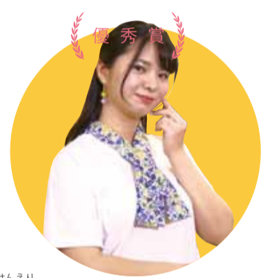
優秀賞 はんえり 半衿Tシャツ(琉装・和装インナー)

しゃぶしゃぶと島豚料理みなみ 久米2-11-4 久米ガーデンビル1A ☎943-2729