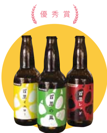
優秀賞 クラフトビール『首里三部作』

市では、市内で生産・製造され、5年以内に販売されている商品の中から、優れたものを選出し、那覇市長賞を授与しています。今年度の市長賞に選ばれた、最優秀賞2点、優秀賞6点の商品をご紹介します。 ※じょーとーむん…沖縄の方言で「優れたもの」という意味 商工農水課 ☎951-3212