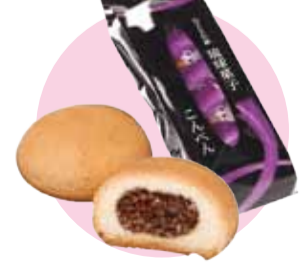
琉球菓子こんぺん 南島製菓(株) 松尾2-11-28 ☎863-3717