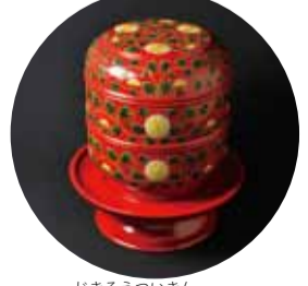
じきろうついぎん 6寸二段喰籠堆錦 色付菊唐草 (株)角萬漆器 前島2-1-6 ☎867-1591