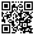
コロナワクチンナビ