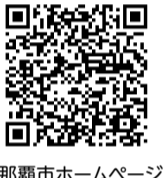
那覇市ホームページ