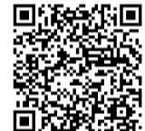
那覇市ホームページ