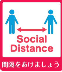
Social Distance 間隔をあけましょう