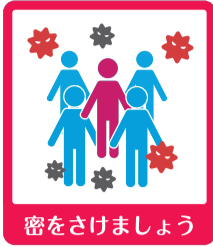
密をさけましょう