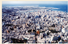
発展を遂げる那覇市街