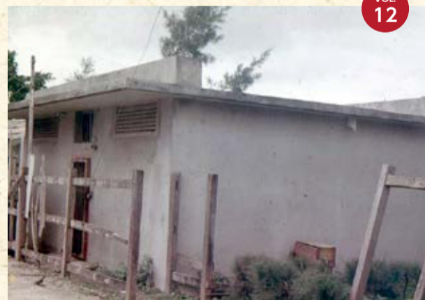
1964年真和志支所の一角にあった監置所

(琉球) 政府が補助金を出し、区が造った監置所があった。公営の監置所である」と記しています。 ぶんかテンプス館3階ギャラリーでは、4月4日まで私宅監置を問う写真展を開催しています。