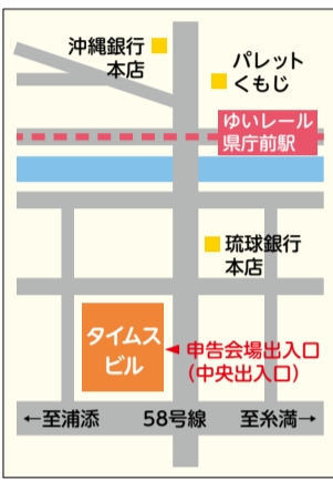
申告会場(タイムスビル)には、専用駐車場はありません。公共交通機関をご利用ください。