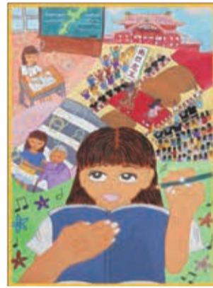
令和元年度 最優秀賞作品

「なは教育の日」ポスター原画・標語作品を募集します。 【テーマ】 「教育」と「夢・希望・挑戦」 「みんなで教育の大切さを考える」 対 市内の小中学生 申 9月30日(水)まで ※詳しくは市ホームページをご確認ください。 生涯学習課 ☎917-3502