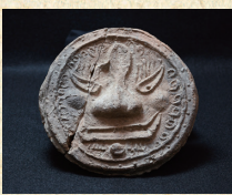
渡地村 出土遺物写真