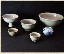
渡地村 出土遺物写真