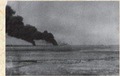
1944年10月10日 空襲により炎上する日本側輸送船

1944年(昭和19年)10月10日、戦前の那覇市(現在の国際通りから海側にかけてのいわゆる旧那覇)は市街地や那覇港を中心にアメリカ軍の激しい空襲に見舞われました。現在「10・10空襲」と呼ばれるこの空襲により死者225人、旧那覇市域の90%近くが焼失しました。この空襲で多くの市民が本島北部などへ避難し、そのまま沖縄戦に巻き込まれた方もいました。市民にとつていち早く「戦争」を実感した空襲でした。