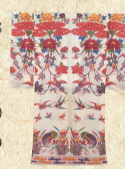
白地牡丹尾長鳥燕鶴草 蒲文様紅型平絹衣装

那覇市歴史博物館では常設展の一部を使用したトピック展示として「10・10空襲」を3部構成で取り上げます。最初に「10・10空襲」によって失われる前のかつての那覇の姿を写真パネルやジオラマで紹介します。次に米軍が沖縄で初めて試験的に使用し、その後本土空襲での使用に結びついたといわれる「焼夷弾」が猛威をふるった様子を写真パネルなどで展示します。 最後に1971年10月10日に市制施行50周年記念事業として復活した那覇大綱挽を紹介し、祭りを通して戦後復興のあゆみを伝える資料を展示します。 9月28日(金)~10月29日(月) 期 9月28日(金)~10月29日(月) 国宝尚家資料10月の特別展示 「鳥が描かれた紅型衣装」 1971年10月10日 再開した那覇大綱挽の様子