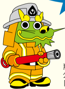
那覇市消防局 公認マスコット 「はりゅうくん」

「119番」は、あわてずに、落ち着いて！救急車や消防車が向かう住所(場所)を「正確に」伝えてね！