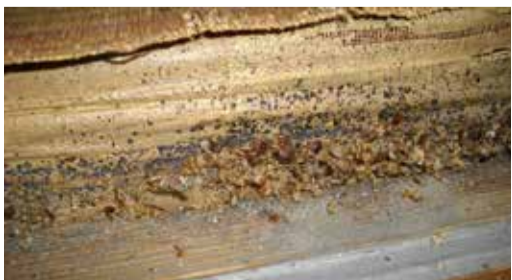
畳に潜んだトコジラミ

保健所生活衛生課 ☎ 853-7963 沖縄県ペストコントロール協会 ☎ 868-22789